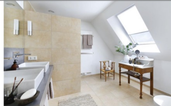
Das neue Badezimmer unterm Dach wird von einem Dachfenster erhellt. Der Fensterlüfter „Smart Ventilation“ sorgt dafür, dass feuchte Luft zum Beispiel nach dem Duschen schnell über die Lüftungsklappe des Fensters abtransportiert wird und beugt so dem Risiko der Schimmelbildung vor.

In der Ferienwohnung sorgen nun insgesamt sechs Dachfenster dafür, dass die Gäste in allen Bereichen der Wohnung mit Licht, Luft und Ausblick versorgt werden. Im modern und liebevoll eingerichteten großen Raum mit Platz zum Wohnen, Essen und Kochen bieten gleich drei Velux-Fenster den Gästen von fast überall den grandiosen