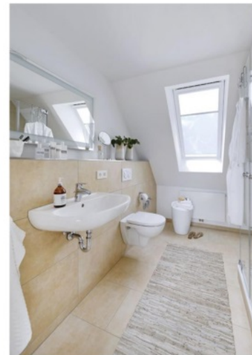
Das moderne Duschbad der Ferienwohnung profitiert von viel Tageslicht durch das Velux-Fenster. Ein Sichtschutz-Rollo schützt vor neugierigen Blicken und taucht den Raum in weiches Licht.