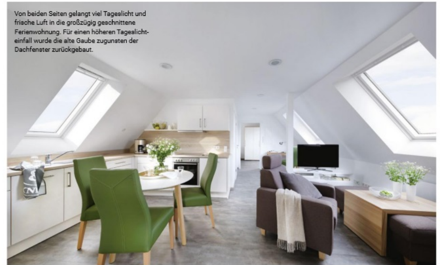
Von beiden Seiten gelangt viel Tageslicht und frische Luft in die großzügig geschnittene Ferienwohnung. Für einen höheren Tageslichteinfall wurde die alte Gaube zugunsten der Dachfenster zurückgebaut.